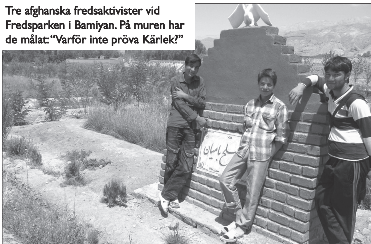
Tre afghanska fredsaktivister vid Fredsparken i Bamiyan. På muren har de målat: "Varför inte pröva Kärlek?"

Vem kunde föreställa sig afghanska ungdomar från bergsbyarna i Bamiyan-provinsen, ca 160 km från Kabul, i en sammansvetsad, uthållig grupp av fredsaktivister, med ett växande kontaktnätverk av fredsgrupper i andra länder som Palestina och USA?